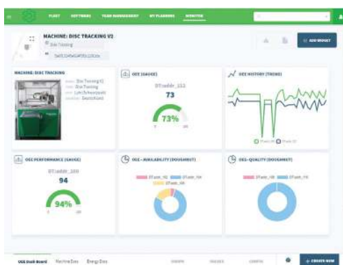
Monitoraggio delle prestazioni e dei dati delle macchine